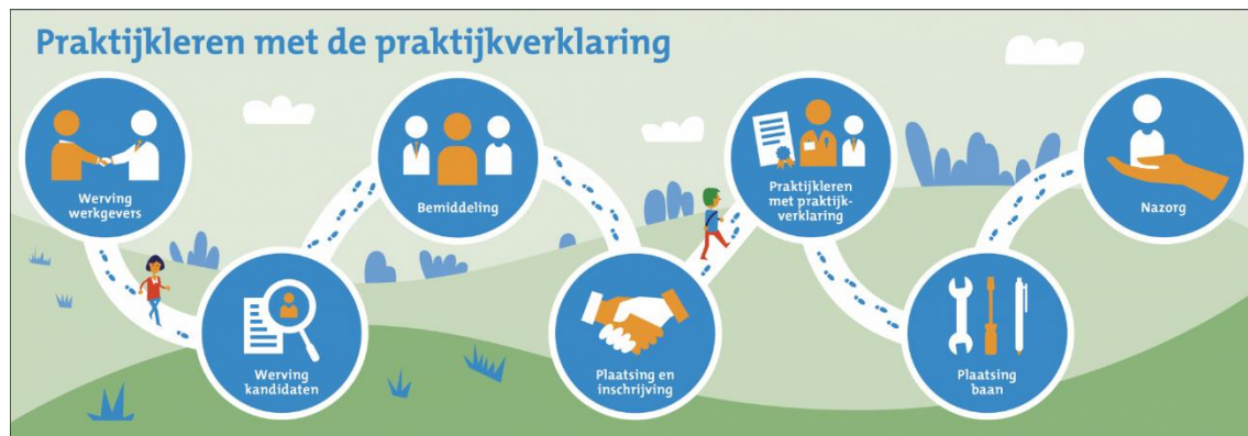
Figuur 1 – Processtappen praktijkleren met praktijkverklaring

In het figuur zijn de processtappen beschreven die samenwerkingsverbanden in een arbeidsmarktregio (voor werkzoekenden) moeten doorlopen voor het realiseren van 'Praktijkleren met de praktijkverklaring'. 7