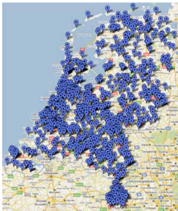
Figuur 1 Spreiding van de respons over Nederland

In oktober 2010 zijn de scholen met relatief veel (vijf of meer) MOE-leerlingen nóg eens benaderd. Doel was om een geactualiseerd en toegespitst beeld te krijgen van de problematiek rondom de MOE-landers in dat type scholen. Over de bevindingen daarvan wordt gerapporteerd in hoofdstuk 4.