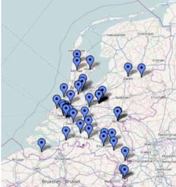
Figuur 2 – Scholen met vijf of meer MOE-leerlingen

Scholen met vijf of meer MOE-leerlingen blijken zich globaal te concentreren op de lijn van Heerlen naar Alkmaar. Ze komen vooral voor in de provincies Limburg en Noord-Brabant, in de Randstad (met Rotterdam/Den Haag als concentratiegebied) en in de kop van Noord-Holland. Deze uitkomst sluit nauw aan bij informatie uit onderzoek van Dirk Korf (2009). Hieruit bleek dat Polen weliswaar door heel Nederland wonen, maar dat er ook concentratiegebieden zijn: de provincies Zuid-Holland, Noord-Brabant en Noord-Holland.