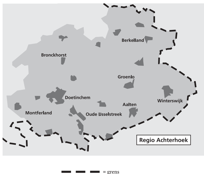
Figuur 1 - Kaart Achterhoek

De Achterhoek is een relatief duidelijk afgebakende regio. Aan de randen is er overlap met naastgelegen regio's (Arnhem/Nijmegen, Stedendriehoek en Twente). De laatste jaren is de aandacht voor grensoverschrijdende samenwerking met Duitse partners sterk toegenomen. Voorheen was er slechts zeer beperkt contact, ook vanwege de gebrekkige vervoersverbindingen over de grens vanuit de Achterhoek. De Regio Achterhoek neemt samen met de Duitse buurregio Kreis Borken deel aan de EUREGIO, een samenwerkingsverband van Duitse en Nederlandse gemeenten op het gebied van onder meer economie en onderwijs. Ook in het beroepsonderwijs nemen de contacten met Duitse partners toe en de verwachting is dat in de komende jaren het belang van samenwerking over de grens zal toenemen. Onder meer in de metaalsector is er bijvoorbeeld samenwerking tussen scholen in de Achterhoek en het Berufskolleg Bocholt-West in Bocholt.